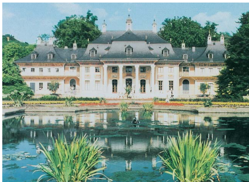
Schloss und Park Pillnitz