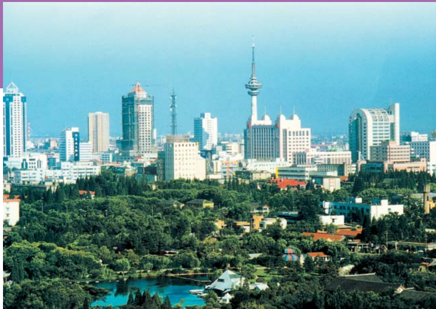
← Skyline der chinesischen Millionen-Metropole Nantong.

wichtiger Wirtschaftszweig – das milde Klima und der fruchtbare Boden sorgen für gute Ernten. Korn, Sesam, verschiedene Gemüse- und Obstsorten sowie Blumen werden weltweit exportiert. Gleiches gilt für die Viehzucht von Schweinen und Ziegen. Als Küstenstadt spielt natürlich die Fischerei traditionell eine entscheidende Rolle und zu guter Letzt darf nicht über die Bedeutung des Hafens – übrigens einer der größten in der Volksrepublik – hinweggesehen werden.