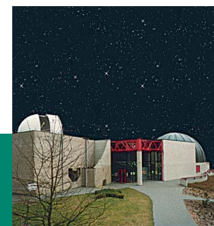
Der Blick auf die Sterne: das Planetarium