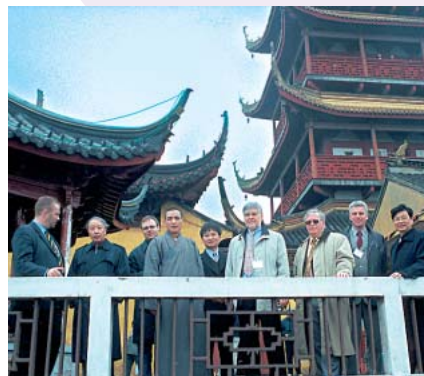
Troisdorfer Delegation vor dem Hanshon-Tempel bei Suzhon

Seit Mitte der 80er Jahre blüht auch der Tourismus in Nantong auf und zu sehen gibt es viel in einer Stadt, die auf eine über 1.000-jährige Geschichte zurückblicken kann. Den Besucher erwartet eine Metropole, in der sich nicht zuletzt in der Architektur die fließende Einheit von Tradition und Moderne widerspiegelt. So findet man hier Seite an Seite typische Bauwerke aus vergangenen Epochen und Bauten der jüngsten Zeit. In der Stadt gibt es mehrere interessante Museen sowie Galerien zu besichtigen und Grünanlagen wie der Zou Taofen Memorial Park laden zum Träumen ein. Überhaupt bietet die Region um Nantong gerade Naturfreunden ein einzigartiges Panorama. Darüber hinaus befindet sich eines von acht Zentren buddhistischer Lehre auf dem nahegelegenen Berg Langshan – die dortige komplexe Klosteranlage ist seit Jahrhunderten ein Ort der Ruhe und Meditation mit außergewöhnlichem Flair.