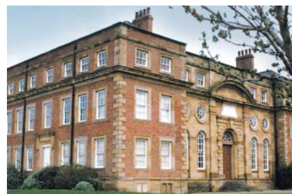
Kirkleatham Old Hall – heute ein Museum