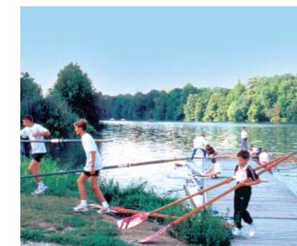
Paddeln und rudern auf der Seine

↑ Cathédrale de l’Essonne auf dem Platz der Menschenrechte. Sie wurde 1996 eingeweiht und war europaweit die einzige Kathedrale, die im 20. Jahrhundert privat finanziert und neu gebaut wurde.