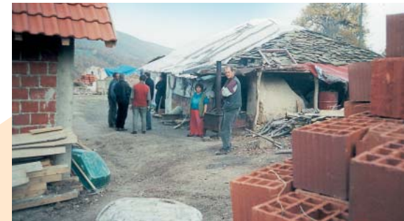
↑ Leider immer noch ein alltäglicher Anblick – wieder aufzubauende Ruinen

Die Patenschaft mit einer Kommune im Kosovo hat auch nach Meinung des Deutschen Städte- und Gemeindebunds, der das Vorhaben begleitet, Modellcharakter und damit Bedeutung für den Stabilitätspakt auf dem Balkan. Sie sei ein Beitrag zur Förderung selbstverwalteter und -bewusster Gemeinden im