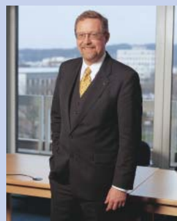
Ihre Stadt Troisdorf

Die Broschüre informiert Sie über die Partnerstädte und den Städtepartnerschaftsverein Troisdorf e.V., der die Organisation der Austauschprogramme übernommen hat. Mit großem Engagement setzen sich die Vereinsmitglieder für lebendige Kontakte zu den Bürgerinnen und Bürgern in den Partnerstädten ein. Zahlreiche Freundschaften sind auf diese Weise über Grenzen hinweg entstanden. Indessen kümmern sich die Troisdorfer Schulen rege um den Austausch von Kindern und Jugendlichen, die sich als Europäerinnen und Europäer kennenlernen.