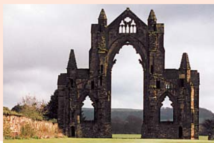
Pittoresk: Abteirueine in Guisborough

In der Ortschaft Saltburn erwartet den Besucher unter dem Motto „Step back into Saltburn's dark past“ ein Wachsfigurenkabinett der besonderen Art und unmittelbar daneben die gemütliche Schmuggler-Pinte „Ship Inn“.