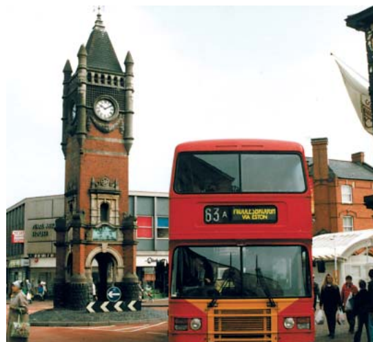
Very british – Redcars Innenstadt