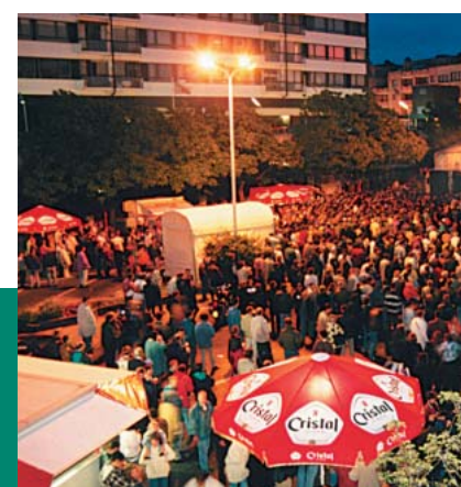
Swingin’ Genk macht die Nacht zum Tag

Auch beim Feiern sind Troisdorfer und Genker einander ebenbürtig: Hier wie dort ist der kunterbunte Karneval einer der Höhepunkte des Jahres. Sogar musikalisch schlagen die Herzen im gleichen Takt: Wichtige Impulse für das hiesige Stadtfest „Swinging Troisdorf“ gab das jeweils im Juni stattfindende dreitägige Musikfest „Swingin’ Genk“.