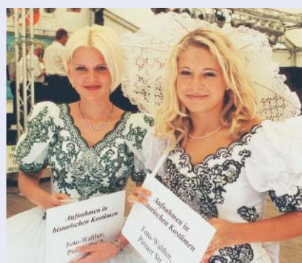
Miss Heidenau (rechts) und ihre Stellvertreterin präsentieren sich und ihre Stadt in historischen Kostümen.

Beliebte Ausflugsziele sind zudem die Burgen und Gärten rund um Heidenau wie Burg Stolpen, Schloss Weesenstein oder die früher unbezwingbare Festung Königstein, die heutzutage von Touristen erobert wird. Sie bietet einen einmaligen Blick auf die markante Felsenlandschaft und das Elbtal.