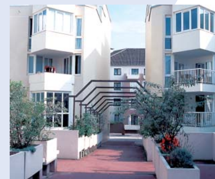
Moderne Wohnungen in Evrys Innenstadt